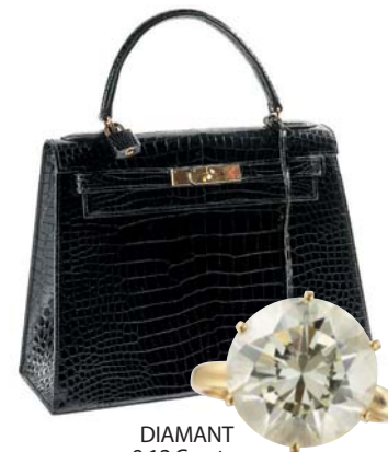
DIAMANT 9,12 Carats