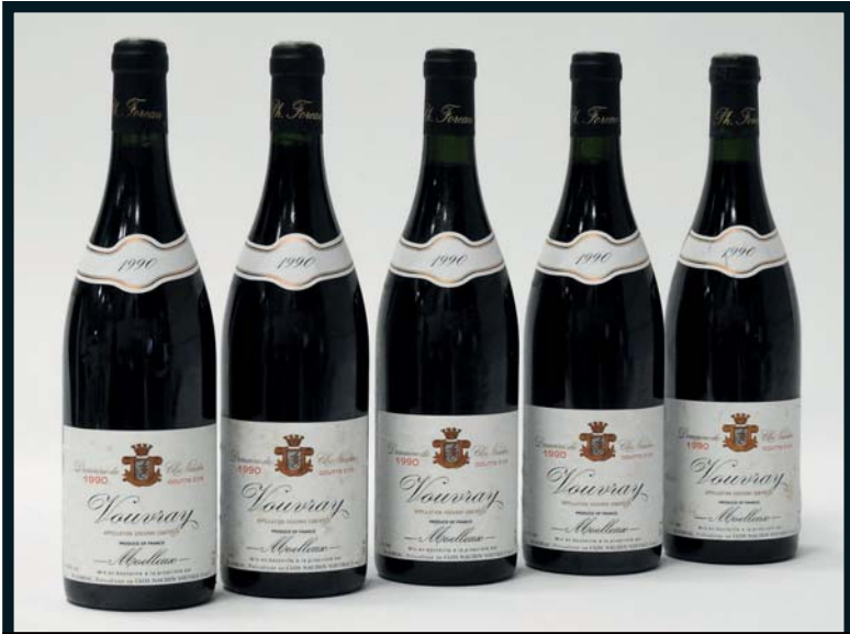
Lots 464 à 468