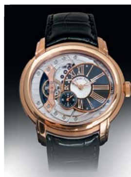
AUDEMARS PIGUET MILLENNARY

LUNDI 14 AOÛT 11H/14H VINS PRESTIGIEUX & ALCOOLS MARDI 15 AOÛT 14H30 ART CONTEMPORAIN, TABLEAUX MODERNES MERCREDI 16 AOÛT 14H BIJOUX, DIAMANTS, MONTRES MERCREDI 16 AOÛT 18H HERMÈS, VUITTON, CHANEL