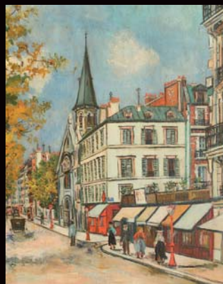
UTRILLO *ADJUGÉ 150 600 €