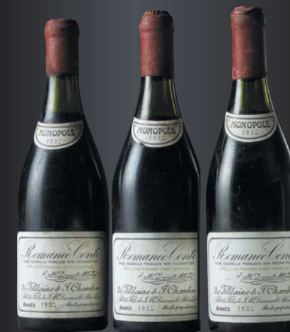
3 BOUTEILLES ROMANÉE-CONTI 1935 *ADJUGÉES 53 000€

Estimation gratuite de vos bouteilles en vue de nos prochaines ventes