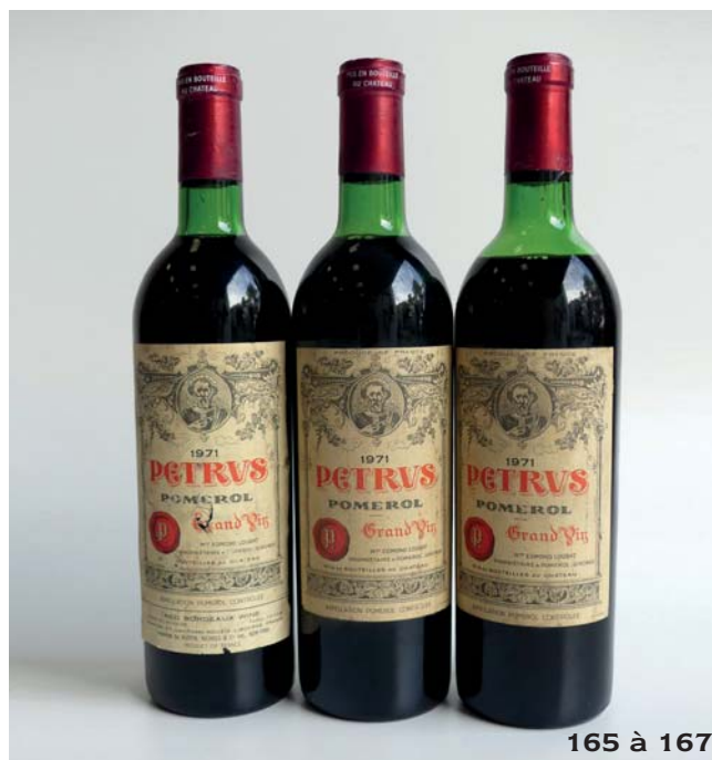
165 à 167