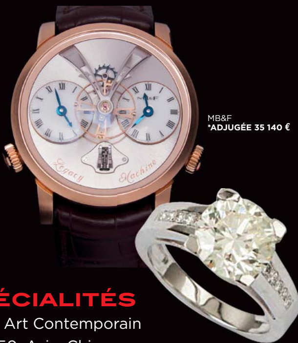
MB&F *ADJUGÉE 35 140 €