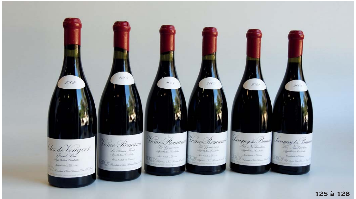
125 à 128