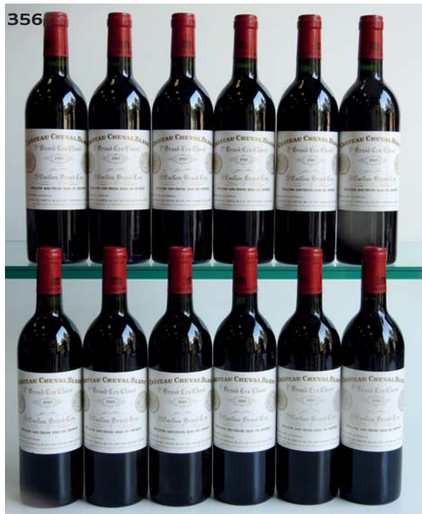
(1 B.G et 1 T.L.B+; 7 étiquettes avec accrocs ou manques minimes) 12 Bouteilles • 2160 / 2400 €