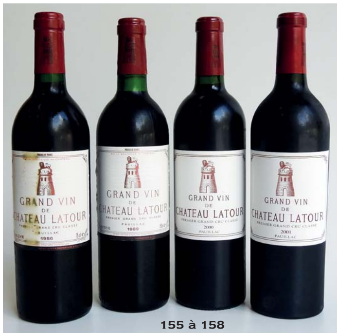
155 à 158

158 CHATEAU LATOUR 2001 GCC1 Pauillac 1 Bouteille • 280 / 300 €