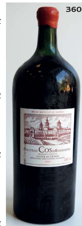
363 CHATEAU D'ISSAN 1985 GCC3 Margaux (10 T.L.B ou mieux et 2 H.E+; quelques c.c) 12 Bouteilles • 270 / 300 €