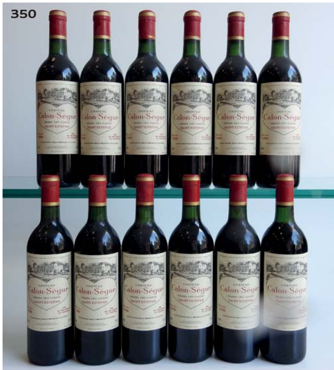
351 CHATEAU CANON 1993 GCC1B Saint-Emilion (quelques très légères marques étiquettes sinon parfaites) 12 Bouteilles • 330 / 360 €