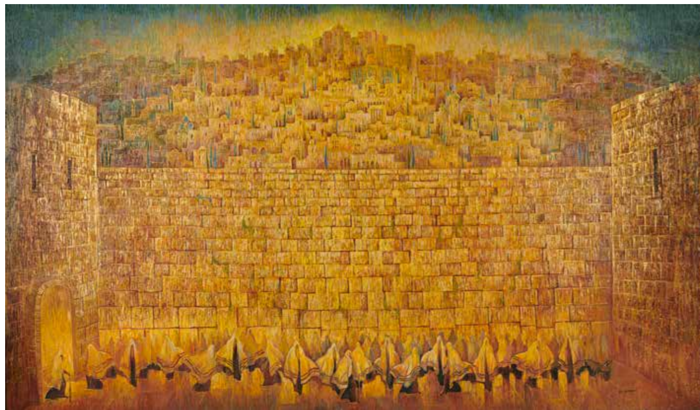
3 - Marina GRIGORYAN (née en 1963) PRAYERS AT THE WESTERN WALL IN JERUSALEM Huile sur toile signée en bas à droite 140 x 240 cm 800 / 1500€