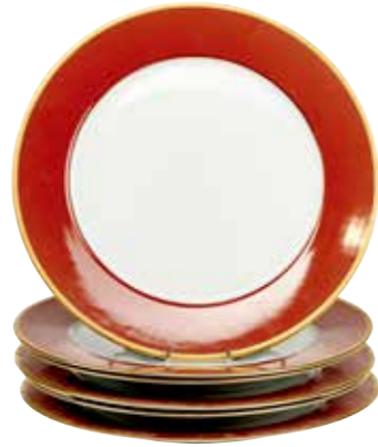
22 - CH. FIELD HAVILAND Limoges Manufacture de porcelaine Robert Haviland & C. Parlon 6 assiettes en porcelaine, marly rouge, décor «terra cotta» Ø : 31,5 cm 50 / 100 €