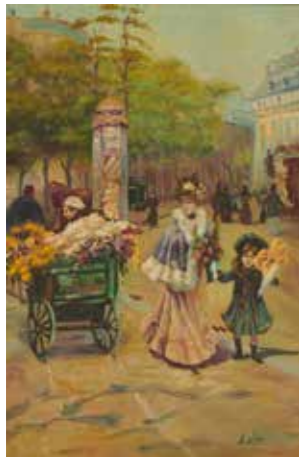
38 - LA MARCHANDE DE FLEURS Toile décorative 91 x 60 cm 50 / 100 €