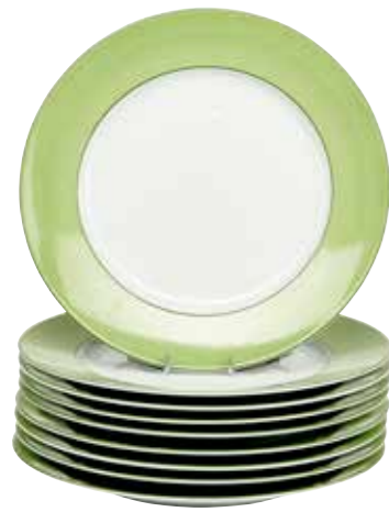
21 - A. RAYNAUD Limoges 9 assiettes en porcelaine blanche marly vert, décor «pareo» Ø : 30 cm 50 / 100 €