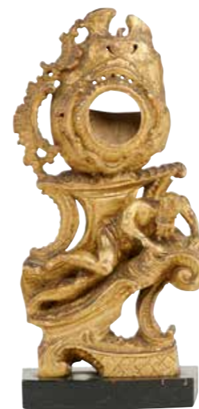
36 - Ancien porte montre de style Louis XV en bois sculpté et partiellement redoré à décor de coquille en partie supérieure et d'un vieillard allongé sur une volute en partie inférieure Hauteur : 33 cm Largeur : 14 cm (Manques) 100 / 150 €