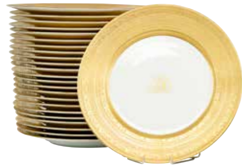
25 - A. RAYNAUD & Co Limoges France 24 exceptionnelles assiettes en porcelaine blanche à décor or fait main à «incrustation double dorure polie à l'agate» chiffées BB Commande spéciale pour l'ancien propriétaire russe du Château de la Garoupe Ø : 30 cm 100 / 200 €