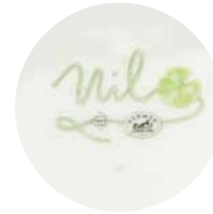
27 - HERMES. Paris Bel ensemble de vaisselle modèle «Nil» en porcelaine de 56 pièces comprenant : - 3 théières (Hauteur : 15 cm) (1 couvercle manquant) - 1 soupière (Longueur : 32 cm) (1 anse cassée) et 1 couvercle seul - 3 tasses à thé (Hauteur : 7,5 cm) (1 ébréchée) - 1 tasse sans anse (Ø : 12,5 cm) (ébréchée)