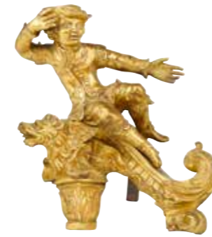
15 - Ancienne paire de chenets

en bronze doré à décor de couple reposant sur une terrasse rocailleuse Hauteur : 30 cm Largeur : 28 cm