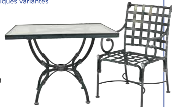
8 - 1 table carrée, plateau verre (100 x 100 cm) et 4 fauteuils