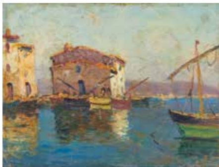
43 - Salomon LE TROPEZIEN (XX e ), d'après SAINT-TROPEZ, LA PONCHE Huile sur panneau 27 x 35 cm 50 / 100 €