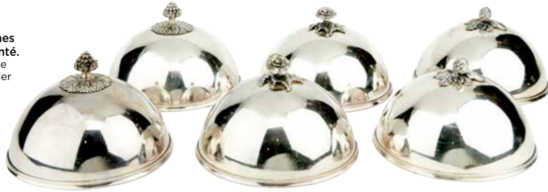
24 - Ensemble de 6 cloches de service en métal argenté. Prises à différents décors de roses, pommes de pin, panier fleuri Hauteur : 14,5 cm Ø : 23 cm (En l'état) 200 / 400 €