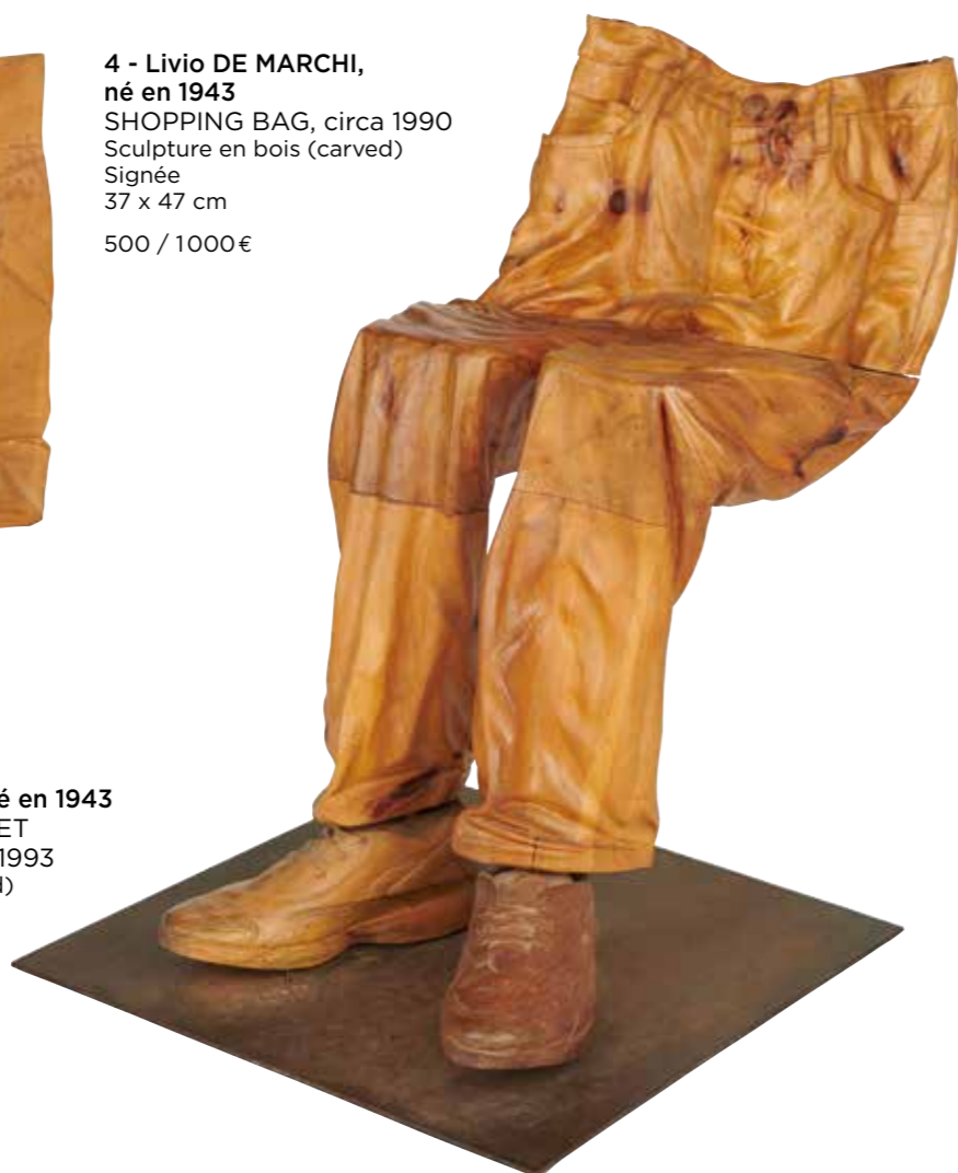
5 - Livio DE MARCHI, né en 1943 CHAISE «PANTALON ET CHAUSSURES», circa 1993 Sculpture en bois (carved) Signée 73 x 64 cm 800 / 1500€