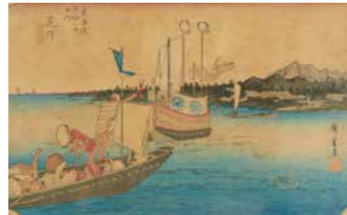
42 - Réunion de 4 paysages animés - Estampes d'HIROSHIGE et de EISEN (pour la 3 e ) format Oban yoko-e