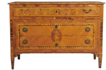
34 - Belle commode italienne néoclassique en bois de placage et décor marqueté de femme à l'antique dans un médaillon et d'une frise de guirlandes, ouvrant par trois tiroirs dont deux sans traverse 86 x 221 x 56 cm Mauvais état d'ébénisterie 400 / 600 €