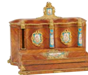
37 - Écritoire en placage de bois de rose garniture de bronze doré et amours dans des médaillons en porcelaine polychrome dans le goût de Sèvres. Époque fin XIX e Hauteur : 44 cm - Longueur : 47 cm - Profondeur : 36 cm Assorti de 2 encrriers (verre et laiton) et 1 encrrier de voyage Manques (dont 1 colonnette en porcelaine côté gauche), accidents 500 / 1000 €