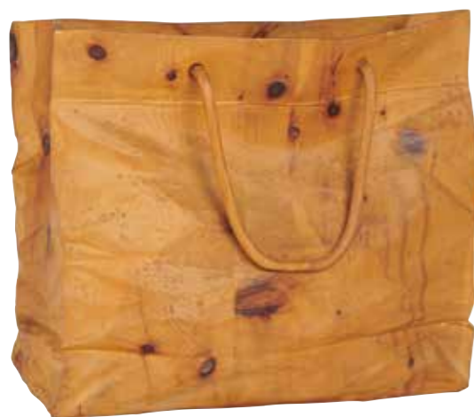
4 - Livio DE MARCHI, né en 1943 SHOPPING BAG, circa 1990 Sculpture en bois (carved) Signée 37 x 47 cm 500 / 1000€