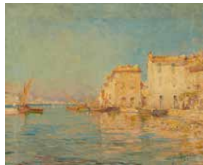
45 - École provençale XX e LES MARTIGUES, LE GRAND CANAL Huile sur toile 47 x 55 cm 150 / 250 €