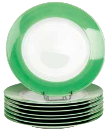
23 - JAMMET SEIGNOLLES, Limoges France 8 assiettes en porcelaine blanche, marly vert, décor «Coco» Ø : 30 cm 50 / 100 €