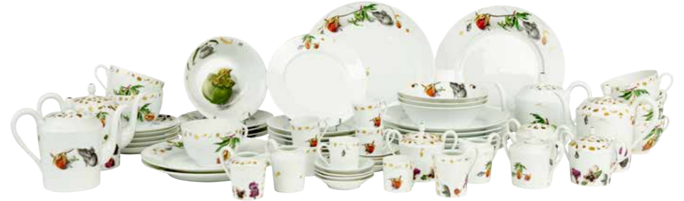
28 - CH. HAVILAND LIMOGES Edité par la Manufacture de porcelaines Robert Haviland & C. Parlon Modèle «Fruits de la passion» par Nall Mediterranean Gold Partie de service en porcelaine de 58 pièces comprenant : - 8 assiettes (Ø : 27 cm) - 4 théières (Hauteur : 18 cm) (3 ébréchées) - 4 pots à lait (Hauteur : 9 cm) (usures) - 6 tasses à café (Hauteur : 6 cm) - 6 tasses à chocolat (Hauteur : 8,5 cm) (2 fêlées) - 8 soucoupes à café - 1 plat rond (Ø : 33 cm) - 1 plat creux (Ø : 31 cm) - 5 assiettes creuses (Ø : 19,5 cm) - 5 soucoupes à chocolat (Ø : 18 cm) - 10 assiettes à dessert (Ø : 19 cm) (5 ébréchées) (Égrenures) 150 / 300 €