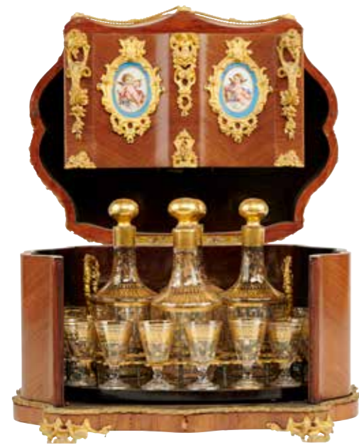
32 - Cave à liqueur en placage de bois de rose garniture de bronze doré, médaillons en porcelaine à décor d'amours dans le goût de Sèvres Époque fin XIX e Hauteur : 30 cm Longueur : 39 cm Profondeur : 29 cm Verres et carafes en verre à décor émaillé or Éclat à une carafe (Manques, accidents) 500 / 1000 €