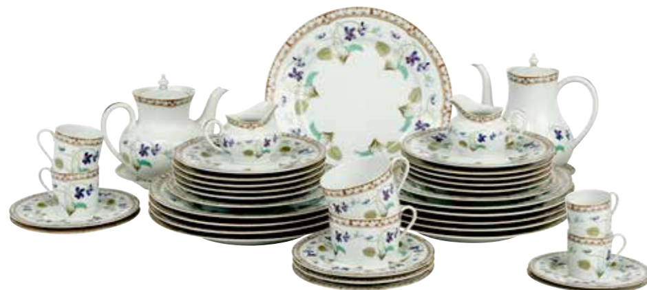
26 - HAVILAND. «Impératrice Eugénie» Partie de service en porcelaine de 40 pièces comprenant : - 10 grandes assiettes (Ø : 26 cm) - 2 assiettes à fromage (Ø : 21,5 cm) (usures) - 1 théière (Hauteur : 18 cm) (ébréchée) - 1 cafetière (Hauteur : 15 cm) (ébréchée) - 2 pots à lait (Hauteur : 8 cm) - 4 tasses à café (Hauteur : 6 cm) - 2 tasses à thé (Hauteur : 6 cm) - 1 soucoupe à café - 7 soucoupes à thé (Ø : 16 cm) (1 ébréchée, 1 fêlée) - 10 soucoupes à dessert (Ø : 19 cm) (1 ébréchée) 150 / 300 €