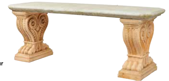
35 - Élégante suite de 4 bancs d'extérieur de style néoclassique. L'assise en pierre reposant sur deux bases en terre cuite terminées par des pieds griffus Hauteur : 56 cm - Longueur : 151 cm Largeur : 47 cm 500 / 1000 €