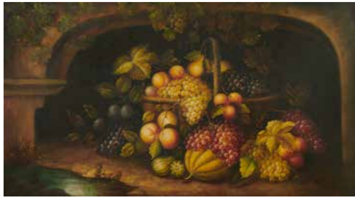
30 - École moderne NATURE MORTE AU PANIER DE FRUITS Toile décorative avec son cadre 100 x 180 cm (hors cadre) 100 / 200 €