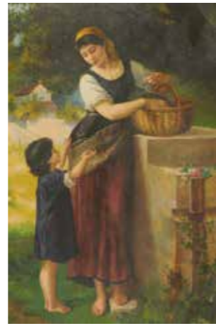
41 - JEUNE FEMME AU PANIER AVEC UN ENFANT Toile décorative 91 x 60 cm 50 / 100 €