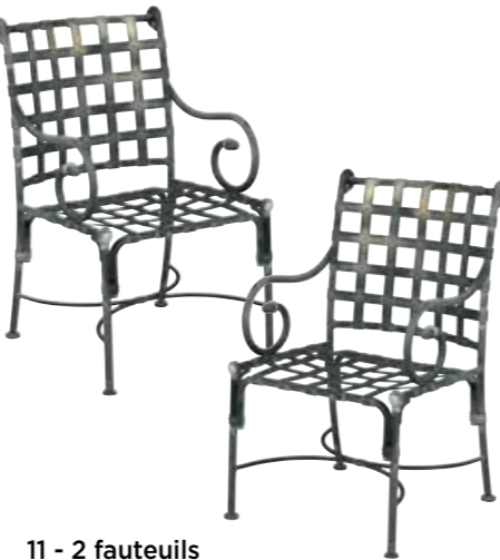
11 - 2 fauteuils