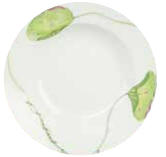
- 3 soucoupes (Ø : 16,5 cm) (2 ébréchées) - 6 tasses à café (Ø : 13 cm) - 12 tasses à thé (Ø : 18 cm) (2 ébréchées) - 9 assiettes creuses (Ø : 22 cm) - 10 grandes assiettes (Ø : 27,5 cm) (3 ébréchées) - 8 assiettes à dessert (Ø : 22,5 cm) (1 ébréchée) 200 / 500 €