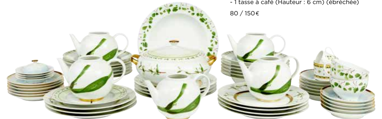
29 - A. RAYNAUD & Co Limoges Christian Tortu Partie de services en porcelaine, décor «Verdures» de 55 pièces comprenant : - 11 assiettes (Ø : 27,5 cm) (1 ébréchée) - 1 assiette à dessert (Ø : 22,5 cm) (usures) - 12 assiettes creuses (Ø : 24 cm) - 6 soucoupes (Ø : 18 cm) - 11 petites soucoupes (Ø : 16 cm) - 4 soucoupes à café (Ø : 12 cm) (1 ébréchée) - 1 plat de service (Ø : 29,5 cm) - 1 soupière (Ø : 29 cm avec anses) - 5 théières (Hauteur : 13 cm) (manque les couvercles) - 2 tasses à thé (Hauteur : 7 cm) (1 ébréchée) - 1 tasse à café (Hauteur : 6 cm) (ébréchée) 80 / 150 €