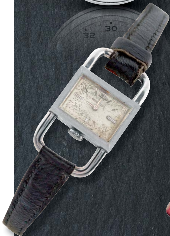
306 - JAEGER LE COULTRE Etrier Circa 1940 HERMES Paris 1670 - 42 n° 1339141 Montre de dame en acier ornée de anses à Lucchetto. Mouvement mécanique à remontage manuel, cadran argenté, index acier appliqués. Cadran, boîtier et mouvement signés. Dimensions 30x15 mm Révision à faire et nettoyage cadran. 200/500 €