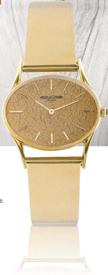
325 - JAEGER LECOULTRE Circa 1970 Fab Suiss . 4 63 21 n 1328636 Montre bracelet d'homme en or 18 cts, boîtier ovale à fond clippé, mouvement mécanique à remontage manuel, cadran fond or, index en or appliqués, remontoir serti d'un saphir cabochon, bracelet en or 18 K avec boucle déployante en or invisible. Cadran, boîtier et mouvement signés. Diamètre 35x25 mm Poids brut 74,5 g 1500/2500 €