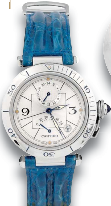
330 - CARTIER Pasha circa 2000 Montre d'homme avec boîtier en acier à fond squelette et boucle déployante en acier signée dans son écrin. Mouvement automatique, cadran guilloché avec guichet de la date vers 4 h, un cadran à 12 h sur 24 h, aiguille à six heures rétrograde pour réserve de marche. Cadran, boîtier et mouvement signés. Diamètre 33 mm 2000/2000 €