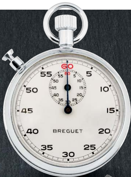
305 - BREGUET Circa 1970 Conte secondes de poche acier. Mouvement à remontage manuel, cadran à fond blanc, index chiffres arabes, remontoir à 12 heures et poussoir à 11 heures. Cadran signé, boîtier numéroté. Diamètre 46 mm À réviser 400/600 €