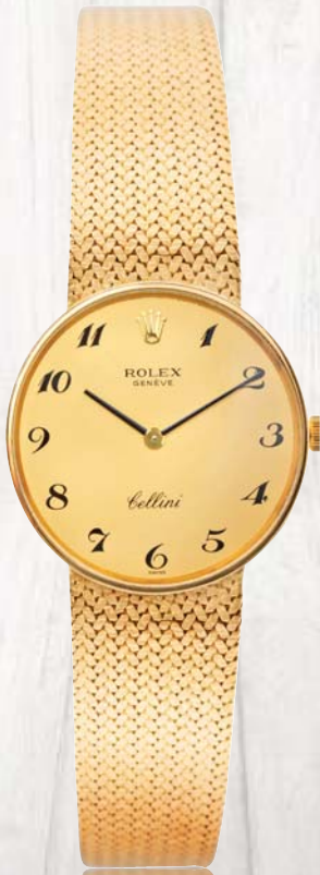
324 - ROLEX Cellini circa 1980 Genève Montre bracelet d'homme en 18 cts boîtier rond à fond clippé, avec boucle déployante invisible signée. Mouvement mécanique à remontage manuel, cadran à fond doré, index chiffres breguet noirs. Cadran, boîtier et mouvement signés. Poids Brut 62,4 g Diamètre 30 mm 2500/3500 €