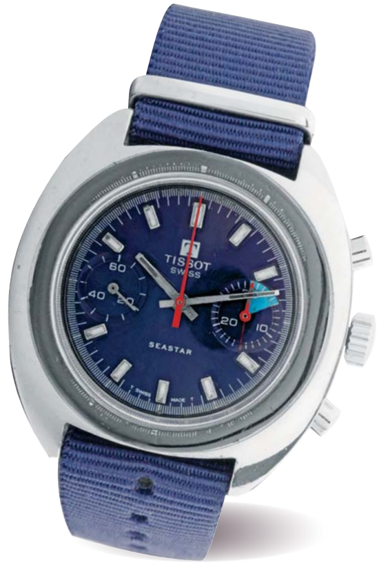
370 - TISSOT Seastar Circa 1970 . Swiss Montre chronographe en acier avec boîtier à fond vissé. Mouvement mécanique remontage manuel, cadran à fond bleu à deux compteurs, index luminescents, deux poussoirs ronds. Cadran, boîtier et mouvement signés. Diamètre 38 mm 700/900 €