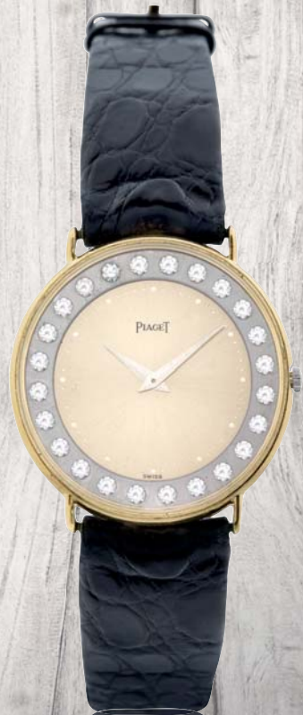
326 - PIAGET Circa 1980 Genève ref 2542 N 440251 Élégante montre demi-plat en or jaune 18 cts, lunette sertie de diamants et boucle ardillon en or signée. Mouvement mécanique à remontage manuel, cadran à fond doré, remontoir en or gris. Cadran, boîtier et mouvement signés. Diamètre 30 mm Poids brut 24,9 g 800/1500 €