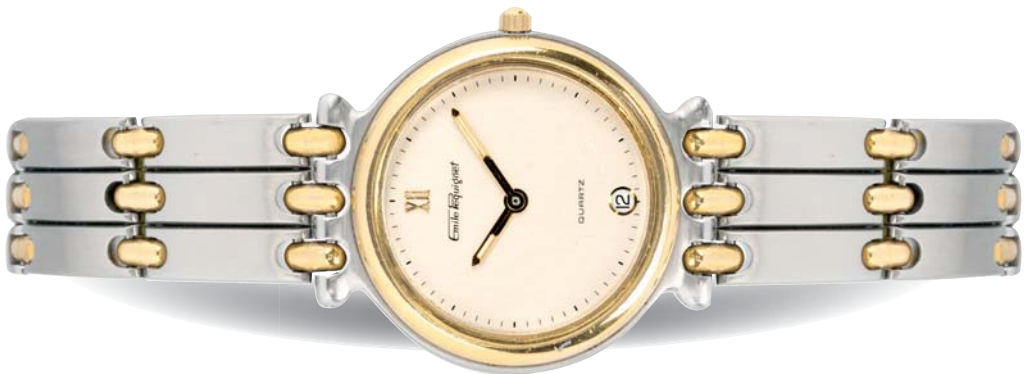
371 - EMILE PEQUIGNET Circa 1980 Montre dame bracelet en acier et plaqué or mouvement quartz. Dans son écrin en bois. 100/200 €