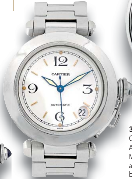
331 - CARTIER Pasha C Circa 2000 Automatic N cc 411635 Montre bracelet en acier, boîtier rond avec bracelet acier et boucle déployante signée. Mouvement automatique, cadran argenté, index chiffres arabes peints en noir, guichet date entre 4 et 5 heures, trotteuse centrale, remontoir serti de saphir cabochon. Cadran, boîtier et mouvement signés. Diamètre 35 mm Dans son écrin avec livret et maillons en acier et une boucle déployante siglée. 1300/1500 €