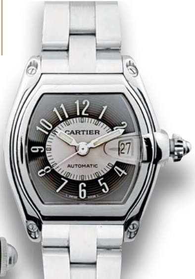
332 - CARTIER Roadster Circa 2000 Automatic N 389022cd 2510 Montre bracelet en acier avec boîtier Galbée à fond à vis boucle déployante invisible signée. Bracelet cuir avec boucle déployante siglée (et son étui en cuir). Mouvement mécanique à remontage automatique, cadran à deux tons, index à chiffres arabes appliqués en acier, guichet de la date à trois heures. Cadran, boîtier et mouvement signés. Dimensions 33x40 mm Dans son écrin avec son livret et maillons supplémentaires. 2000/3000 €