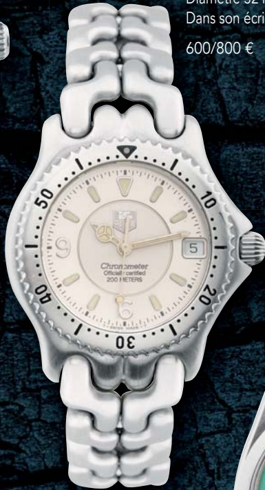
336 - TAG HEUEUR Chronometer Circa 2010 - Officially certified 200 m N 140340 Montre bracelet de dame en acier à fond vissé, boucle déployante invisible signée. Mouvement automatique, cadran argenté index à chiffres arabes luminescents, guichet dateur à trois heures, trotteuse centrale. Cadran, boîtier et mouvement signés. Diamètre 32 mm Dans son écrin avec livrets maillons supplémentaires. 600/800 €