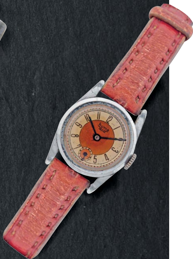
307 - HUMA Circa 1940 Jolie montre pour enfant en acier à fond clippé. Mouvement mécanique à remontage manuel, cadran à deux tons rose et blanc. Cadran, boîtier et mouvement signés. Diamètre 25 mm 150/250 €