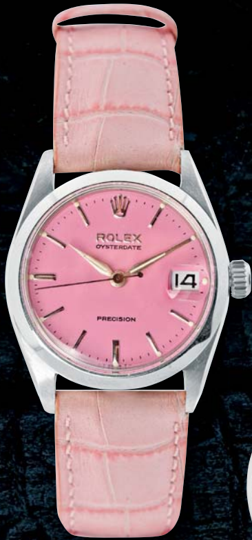
334 - ROLEX Circa 1970 Montre en acier boîtier oyster. Mouvement mécanique à remontage manuel, cadran rose, guichet de la date à trois heures, trotteuse centrale. Cadran, boîtier et mouvement signés. Diamètre 27 mm 1200/1200 €