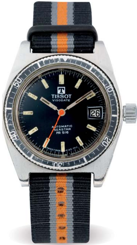
369 - TISSOT Visodate Circa 1970 Automatic seastar PR 516 Fascinante montre en acier à fond vissé avec lunette noire tournante. Mouvement mécanique à remontage automatique, cadran à fond noir index luminescent, dateur à trois heures. Cadran, boîtier et mouvement signés et numérotés. Diamètre 36 mm 350/450 €