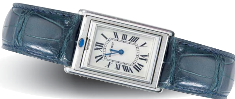
333 - CARTIER Tank Basculante circa 2000 N 7831528 2390 Montre basculante d'homme, modèle mixte, boîtier rectangulaire en acier à boucle ardillon en acier. Mouvement mécanique à remontage manuel, cadran à fond blanc orné d'index à chiffres romains et aiguilles bleues. Cadran boîtier et mouvement signés et numérotés. Dimensions 26x31 mm Dans son écrin avec son livret. 2000/3000 €