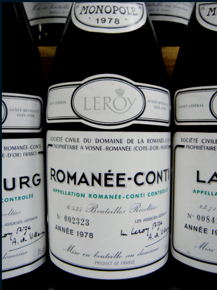
LOT 200 - VENTE DU 14 AOÛT 2011 (ASSORTIMENT DOMAINE DE LA ROMANÉE-CONTI 1978)