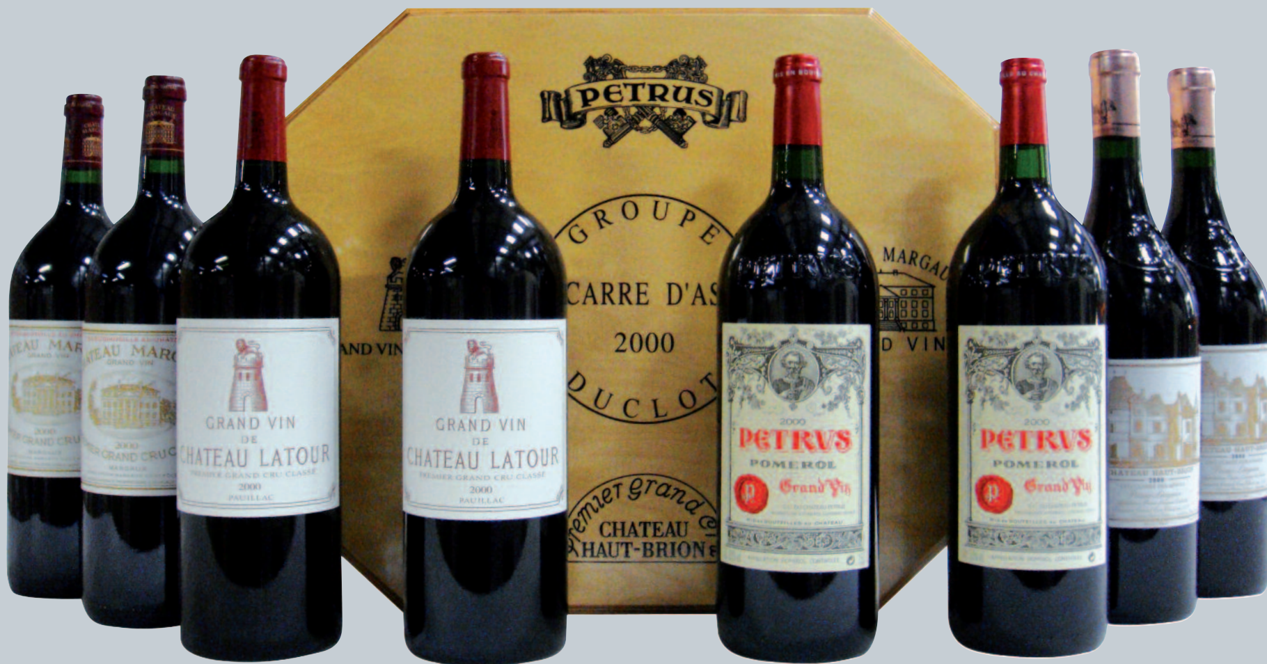
Lot 200 (CARRÉ D'AS 8 MAGNUMS 2000)