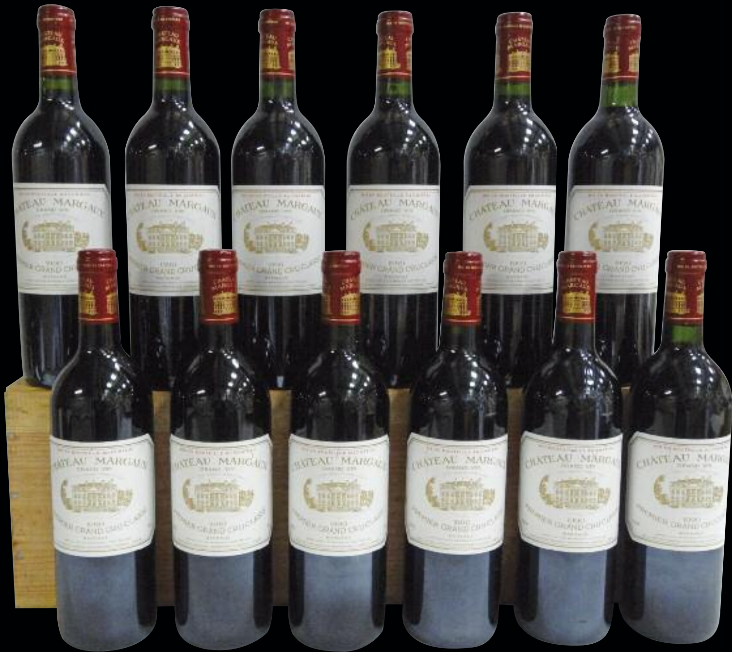
Lot 240 (12 BOUTEILLES CHÂTEAU MARGAUX 1990)