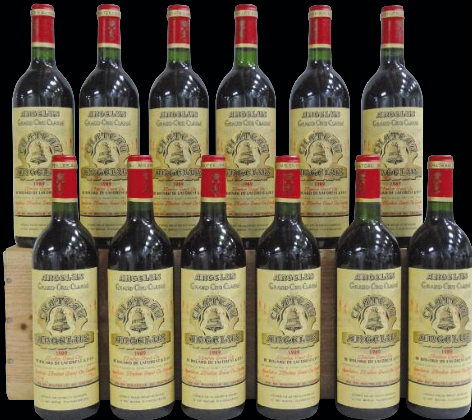
Lot 248 (12 BOUTEILLES CHATEAU ANGELUS 1989)

■ P 1 de couverture de gauche à droite : Lots : 302 - 301 - 300 - 303