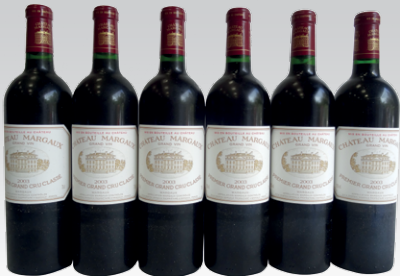
Lot 93 (6 BOUTEILLES CHÂTEAU MARGAUX 2003)