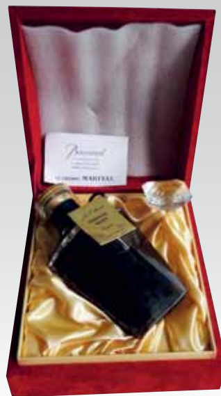
Lot 421 (COGNAC CORDON BLEU)