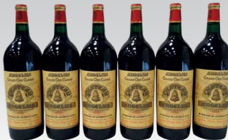
Lot 137 (6 MAGNUMS CHÂTEAU ANGELUS 1995)