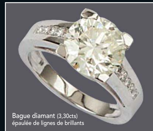
Bague diamant (3,30cts) épaulée de lignes de brillants