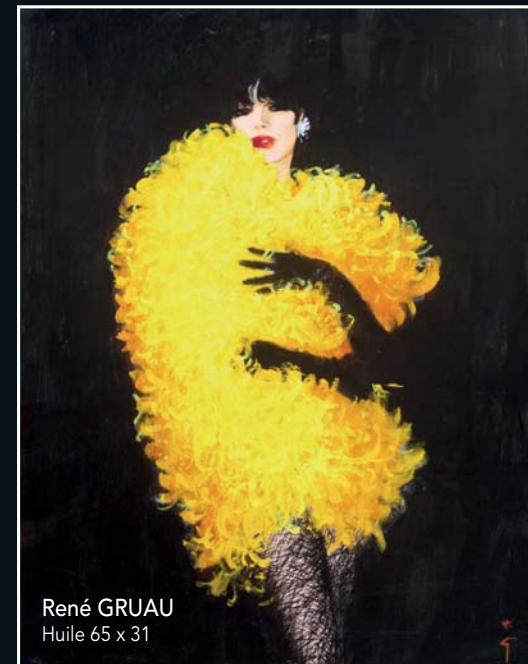
René GRUAU Huile 65 x 31