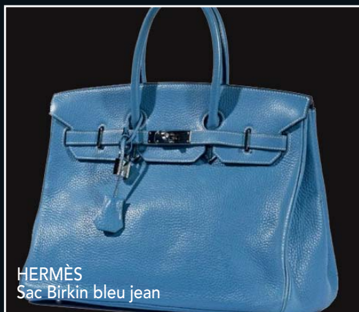
HERMÈS Sac Birkin bleu jean