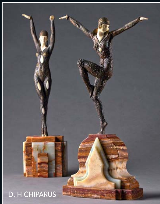
D. H. CHIPARUS

Bijoux signés - Montres de marque Pierres précieuses